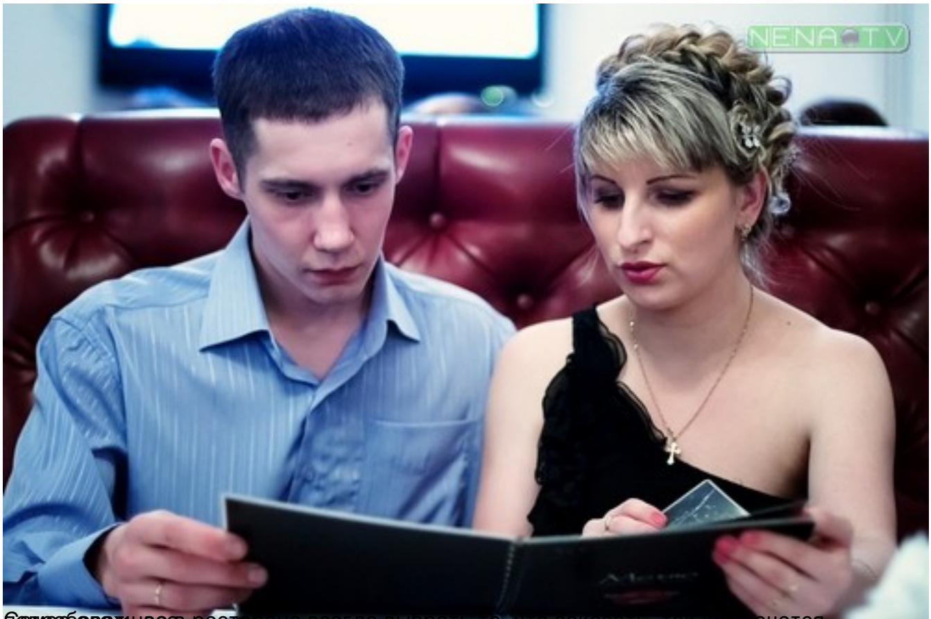
Ближнебровые ищут ресторане время, чтобы им заказать так же уютное

Автор: Наталья Невзорова 15.02.2013 23:44