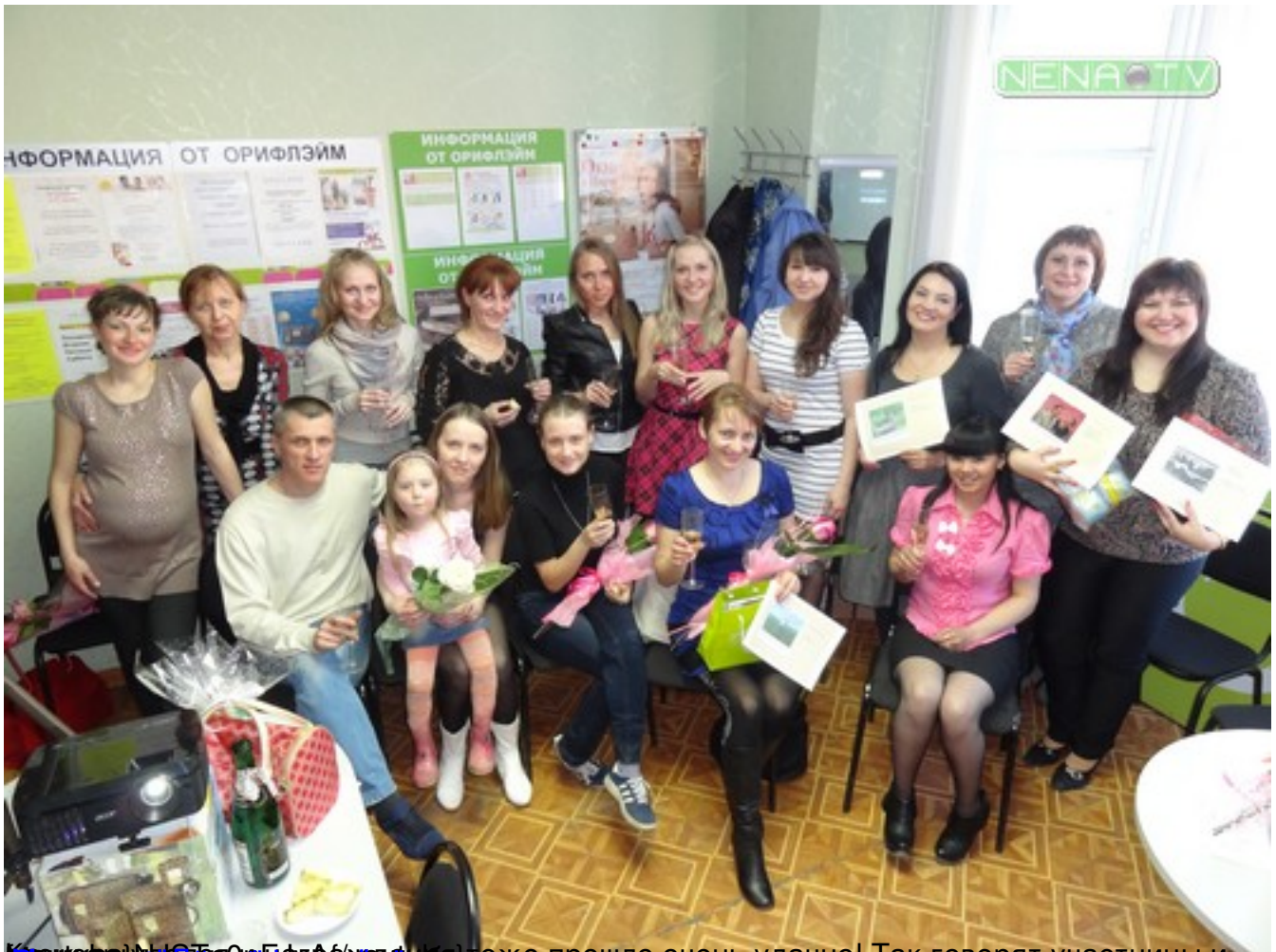
К сожалению, в конкурсе участвовало не так много девушек, но все же праздник прошел очень удачно! Так говорят участницы и организаторы. Мы обязательно продолжим сотрудничество с вами в будущем. Спасибо всем за участие в конкурсе. До новых встреч!