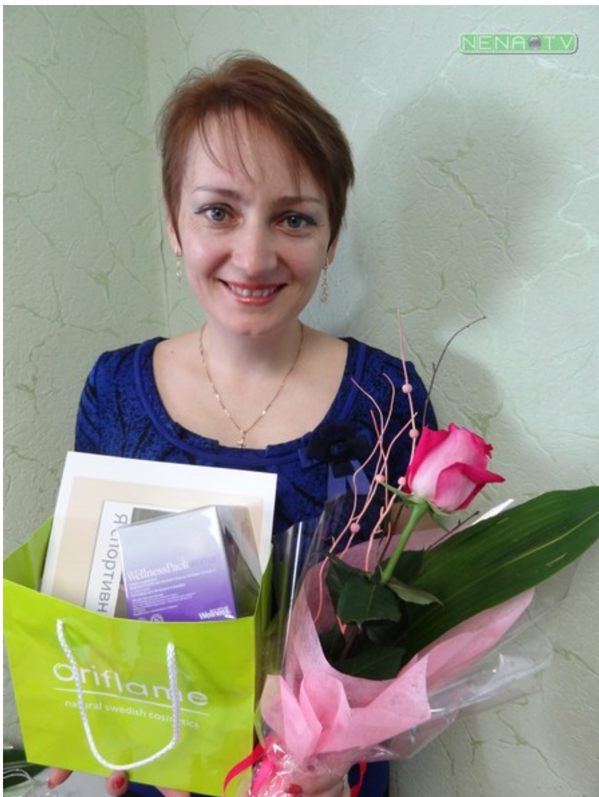
Красивое видео о женском счастье и подарках будет опубликовано на нашем сайте на сайте NENA TV