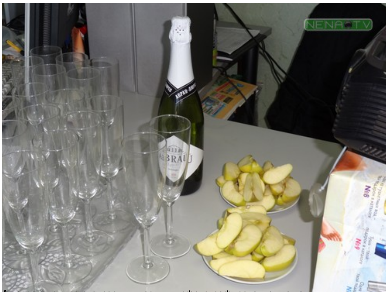
А напоследок все спонсоры и участники сфотографировались на память.